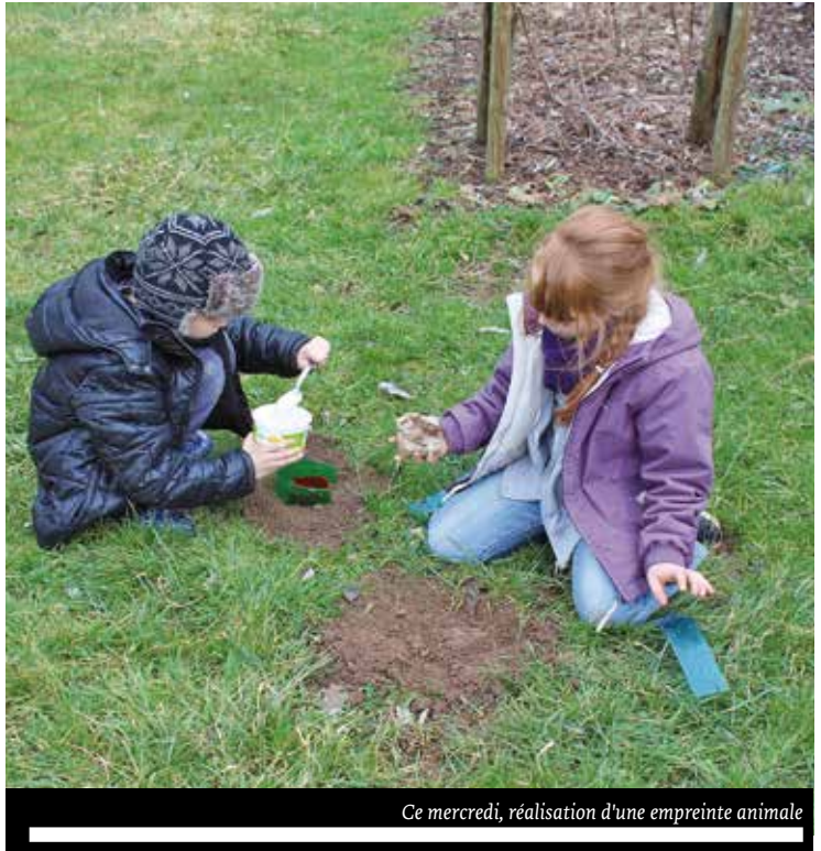
Ce mercredi, réalisation d'une empreinte animale