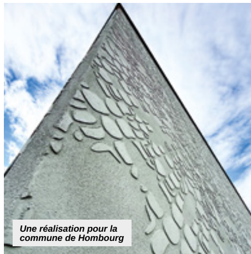
Une réalisation pour la commune de Hombourg