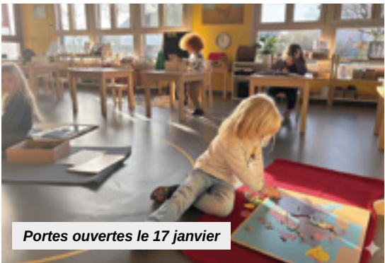
Portes ouvertes le 17 janvier

L'environnement Montessori repose sur une organisation réfléchie, permettant à l'enfant de se repérer, de travailler de manière autonome et de progresser en confiance. Dans l'ambiance 3-6 ans, les enfants explorent les grands domaines sensoriels, le langage, la motricité fine et les mathématiques concrètes, et développent progressivement leur autonomie. C'est l'âge des acquisitions fondamentales. L'ambiance 6-12 ans, correspondant aux niveaux du CP au CM2, invite les enfants à raisonner, à faire des liens et à structurer leur pensée, à travers des recherches autonomes et des travaux collaboratifs. L'équipe pédagogique de