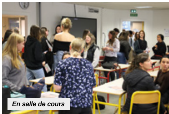
En salle de cours

Praxis propose également une préparation à la sélection d'entrée (formation payante), idéale pour mettre toutes les chances de votre côté. Les sessions se dérouleront