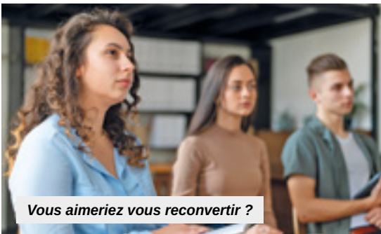
Vous aimeriez vous reconvertir ?

Si l'on inclut l'ensemble des formations dispensées par l'Université de Haute-Alsace, le Serfa propose jusqu'à 140 possibilités, de la gestion jusqu'à la chimie, en passant par le management ou encore la mécanique industrielle, les ressources humaines, la communication, l'informatique et le web... La majorité des formations y est diplômante, même si des possibilités de formations courtes de quelques jours existent. 500 adultes y passent des diplômes chaque année en vue d'une amélioration de leur situation professionnelle, voire d'une complète reconversion. Une réalité qui ne fait que s'accélérer ces dernières années.