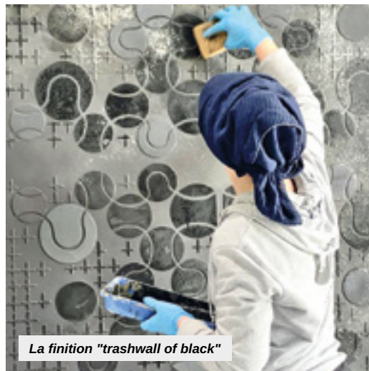
La finition "trashwall of black"