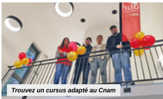
Trouvez un cursus adapté au Cnam

Le Cnam Grand Est déploie une approche pédagogique qui combine innovation, flexibilité et accompagnement personnalisé. Les auditeurs bénéficient d'outils numériques performants, mais aussi de simulations et ressources interactives. Les études de cas, projets collaboratifs et mises en situation renforcent la dimension professionnelle des enseignements. Les alternants soulignent régulièrement la qualité de cet encadrement : « Ce qui me plaît le plus au Cnam, c'est la compétence des formateurs. Je peux compléter ce que je vois en entreprise avec ce que j'apprends en