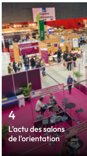
4 L'actu des salons de l'orientation

Dans nos pages, plusieurs reportages au contact direct des étudiants et étudiantes des environs et des différents établissements du Haut-Rhin. Ce supplément est annuel, mais chaque mois, dans votre JDS habituel, retrouvez l'actualité de la formation dans notre rubrique dédiée. Bonne lecture.