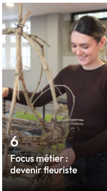
6 Focus métier : devenir fleuriste