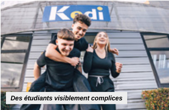
Des étudiants visiblement complices

Les étudiants en deuxième année de Mastère donneront cette année une nouvelle dimension à leur projet humanitaire "7 for Humanity". Pour rappel, ils avaient remporté le premier prix du Prix d'Excellence des Droits Humains lors de l'Assemblée Générale de la FEDE (l'organisme certificateur du diplôme) en avril dernier dans la ville de Budapest, en Hongrie. Cette année, ils se rendront à Malaga, en Espagne, afin de poursuivre leurs travaux sur la thématique de l'immigration, un enjeu sociétal au cœur de leur réflexion depuis plusieurs mois. Ce déplacement sera pour eux l'occasion de rencontrer des acteurs locaux, d'approfondir leurs recherches et de faire évoluer un projet qui associe engagement social et expertise professionnelle.