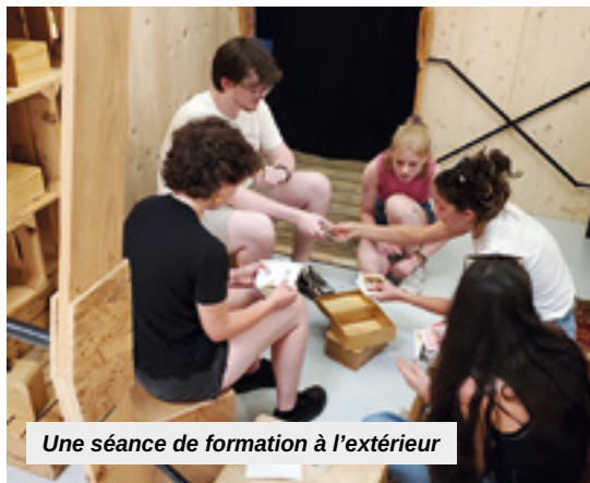
Une séance de formation à l'extérieur

Rencontrez l'ESEIS, ses apprenants et des professionnels lors des journées portes ouvertes du 10 mars prochain sur le site de Mulhouse, ou aux divers salons régionaux d'orientation. Plus d'informations sur : www.eseis-afris.eu