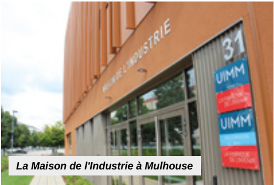
La Maison de l'Industrie à Mulhouse

Avec l'évolution des technologies et la modernisation des équipements dans le secteur de l'industrie, les entreprises recherchent constamment du personnel qualifié. Pour répondre à cet objectif, le Pôle formation UIMM Alsace forme des apprenants de 15 à 29 ans aux métiers techniques de l'industrie par la voie