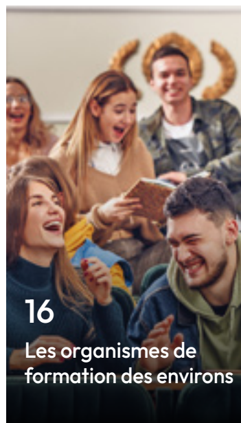
16 Les organismes de formation des environs

Supplément du JDS n°392 - Janvier 2026 28 rue François Spoerry 68100 Mulhouse 03 89 33 42 40 - info@jds.fr Dépôt légal à parution - Impression CE Éditeur : Info Région Edition, Sàrl au capital de 20000 €